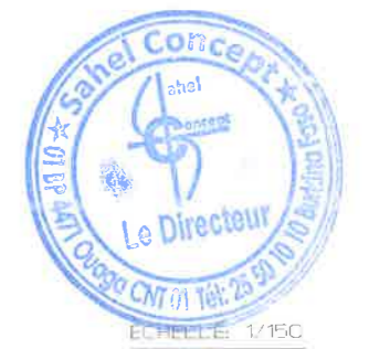
PLAN D'ELECTRICITE RDC